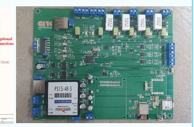
Fig.5 알고리즘 적용 제어용 인버터 보드 설계