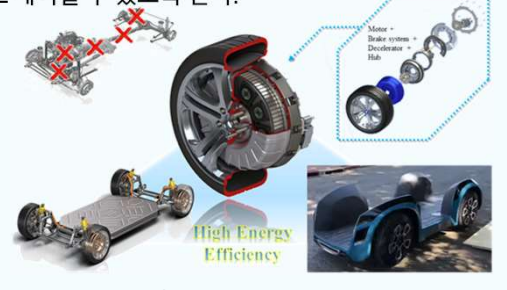
Fig.1 인휠모터 등장에 따른 구조 변화

제안하고자 하는 알고리즘은 인휠모터 주변과 제어용 인버터에 전압, 전류, 온도 센서를 장착하여 인휠모터를 실시간 모니터링하여 정상동작 범위를 벗어난 요소들을 사용자에게 알려주어 초소형 자율주행 차량을 효과적으로 제어할 수 있도록 한다.